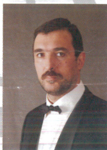
Константин Ганшин (Россия) пианист